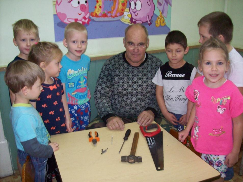
Встреча в ДОУ с людьми разных профессий